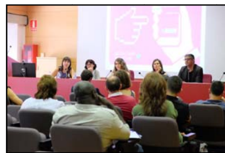
El libro se puede leer y descargar online en Slideshare o en el blog del proyecto ComTur 2.0