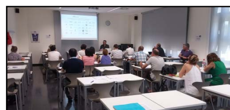
Imágenes del taller formativo celebrado en Vila-seca, fotografía superior, y en Tortosa.